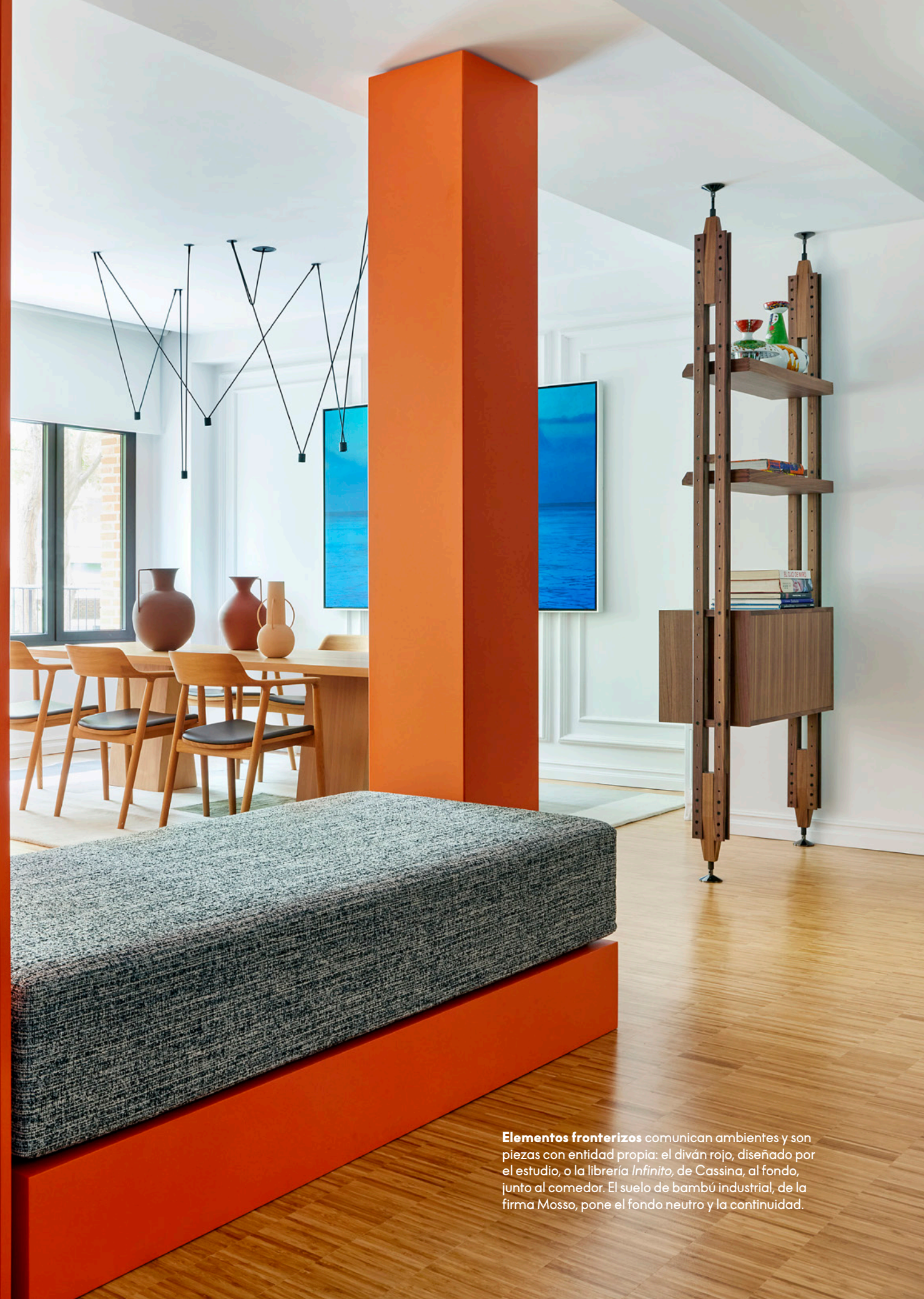
Elementos fronterizos comunican ambientes y son piezas con entidad propia: el diván rojo, diseñado por el estudio, o la librería Infinito , de Cassina, al fondo, junto al comedor. El suelo de bambú industrial, de la firma Mosso, pone el fondo neutro y la continuidad.

E l juego es el leitmotiv en esta casa. El de la línea recta con la curva, el de las distintas texturas, el del color en grandes dosis. Alegre, camaleónica, poco convencional y con ambientes conectados, para compartir espacios y charlas: así la querían sus propietarios.